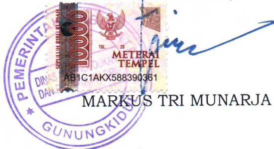
MARKUS TRI MUNARJA